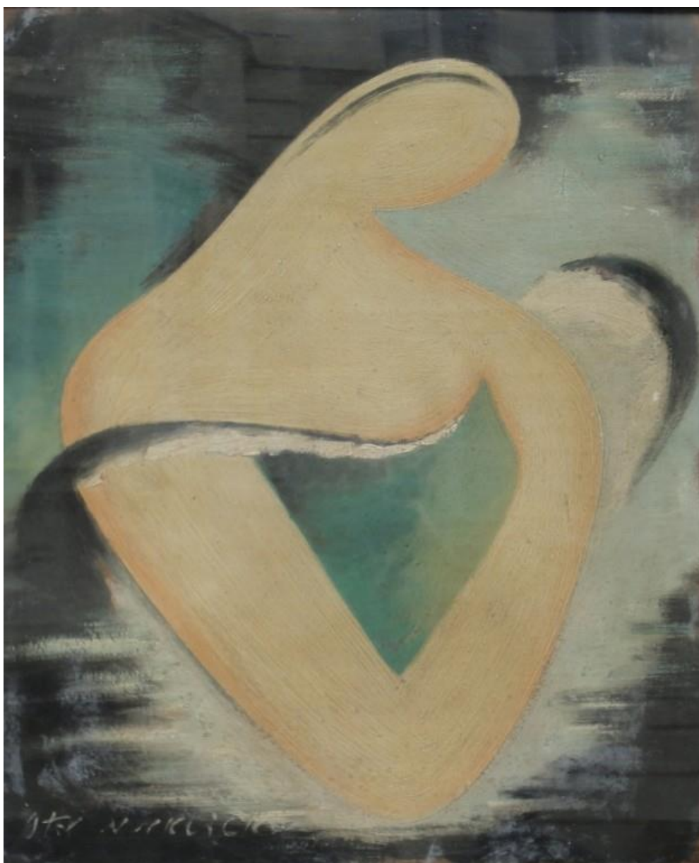
100 Otakar Mrkvička: Matka s dítětem - Světská madona, olej na kartonu

AAA, s.r.o. zápis v obchodním rejstříku u Krajského soudu v Brně oddíl C, vložka 5856 IČ 46902058